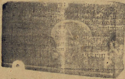
Modelo 6 valvulas, mostrador colorido

Os radios BELMONT são montados em artisticos moveis, de esmerado acabamento e extraordinaria belleza