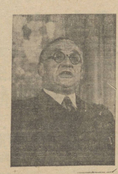
SR. ERNEST BEVIN

MARCADAS DIA E HORA POR CHURCHILL, ROOSEVELT E STALIN