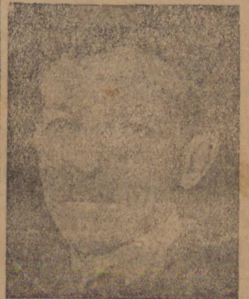
Embaixador Afranio de Melo Franco

O decreto estabelece que a bandeira nacional seja hasteada à meio-fio em todas as repartições publicas e que a Chancelaria organize solenes honras fúnebres.