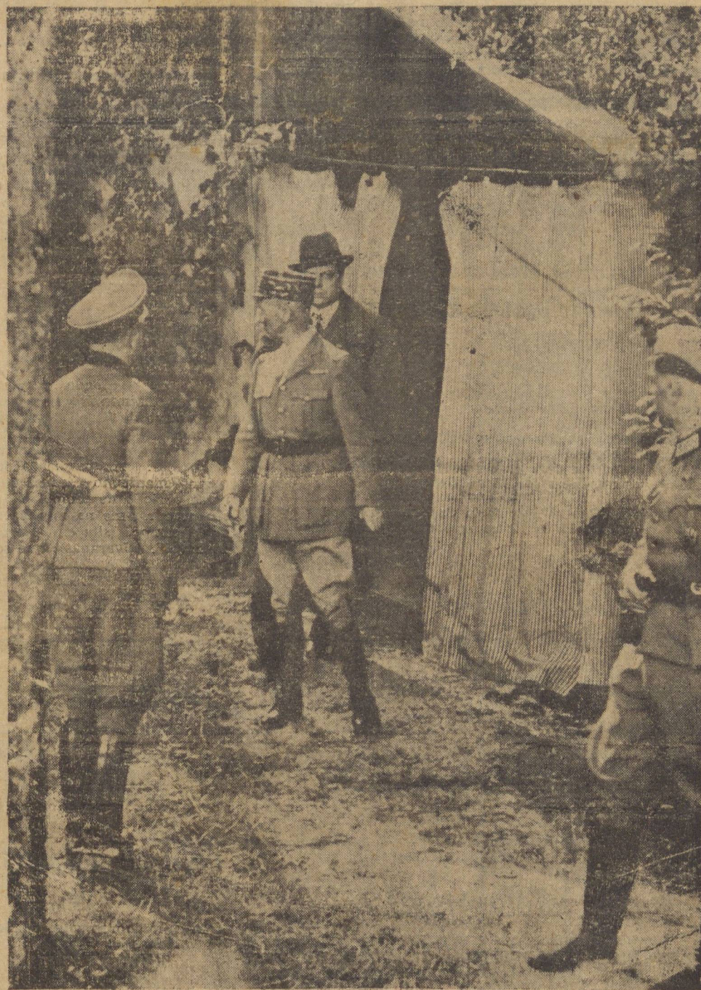
UMA FOTOGRAFIA HISTÓRICA — O general Hutzinger, como delegado da França vinda, deixa sua tenda e se encaminha para receber as condições alemãs de armistício.

VICHY, 24 (A. N.) — O chefe do governo francês, marechal Petain, designou o general Hutzinger para ir a Paris afim de conferenciar com as autoridades alemãs.