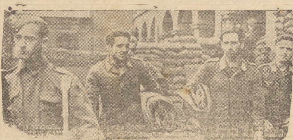
PILOTOS GERMANICOS ABA TIPOS SOBRE SUEZ POR UM CAÇA BRITANICO — A aviação inimiga no Oriente Médio demonstrou não ser um adversario temível para os caças britânicos e aliados, que estabeleceram a supremacia sobre as forças do Eixo desde o inicio da ofensiva britânica na Líbia. Três aviadores alemães a caminho de um campo de concentrações britânico. O "Heinkel" que pilotavam foi abatido na zona do Canal de Suez por um caça noturno canadense. Dois corsários germanicos foram destruidos por caças noturnos britânicos nessa ação, que ocorreu em março de 1942.

é indispensavel no periodo do crescimento. Fortifica e desenvolve normalmente. Evita as doenças da infancia, facilitadas pela Anemia. Corrige a nutrição deficiente. Aumenta o apetite, engorda e desenvolve as cores. Para as meninas no periodo da puberdade, é garantia contra os desarranjos futuros. Vende-se em garrafal ou vidros. — O vidro custa menos. A garrafa tem maior quantidade.