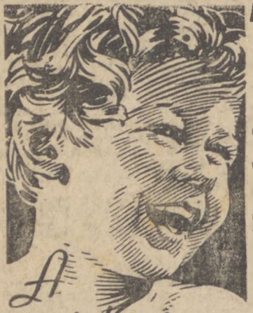
A carinha risonha

O esplendor do progresso e das possibilidades futuras do visinho munhão refletidos no imponente certame!