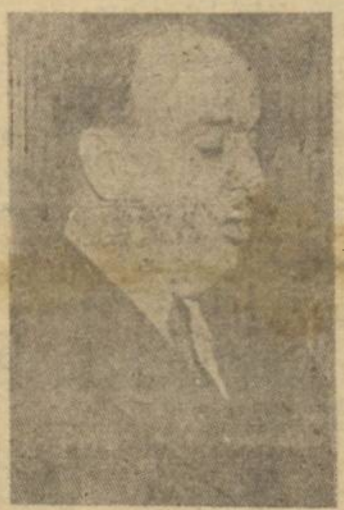
MINISTRO SOUZA COSTA

da conta, ainda, do cuidado que a companhia dispensa aos filhos dos seus operários, contando para tal com esplêndida escola primária, cuja matrícula ascende a 400 crianças. Quanto aos jovens mais adiantados, frequentam o curso secundário dum bom estabelecimento situado em Barra Mansa, para onde se transportam diariamente em ônibus.