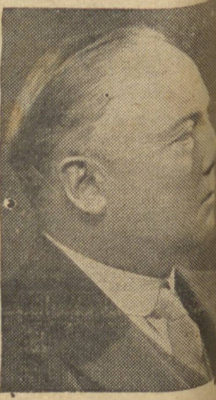
SIR JAMES GRIGG

OXFORD, 5 (U. P.) — secretario de Estado britânico para Negocios de Guerra, sr. James Grigg, falando na Universidade local, solicitou