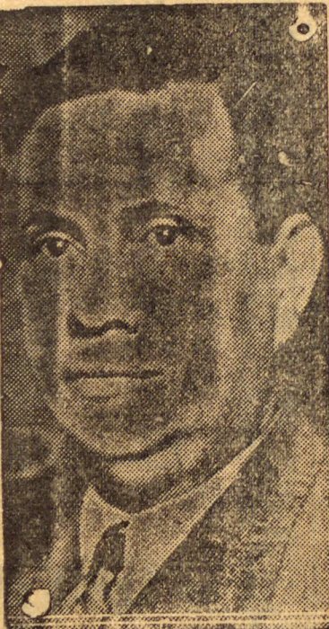
Gal. Goes Monteiro, uma das nossas maiores autoridades militares

de, os unicos interesses que se devem defender, são os do nosso commercio, de accordo com as contingencias da realidade. As palavras que o general Goes Monteiro divulgou outro dia, tratando da falta de aparelhamento do nosso Exército, e de todas as nossas ausencias, são nos devem impressionar pelo que toca a