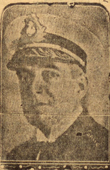
Almirante Protogenes Guimarães, novo governador do Estado do Rio

O edificio onde funciona a Assembléa Legislativa estava guardado por policiaes de armas embaladas e até metralhadoras, alli destacados para garantirem a eleição do primeiro magistrado fluminense, pois corriam o mais desconhecido boato sobre perturbação da ordem por parte dos elementos que compoem a União Progressista, os quaes demonstraram grande descontentamento com a derrota do gal. Christóvão Barcellos, que se annunciava claramente com o levantamento da candida-