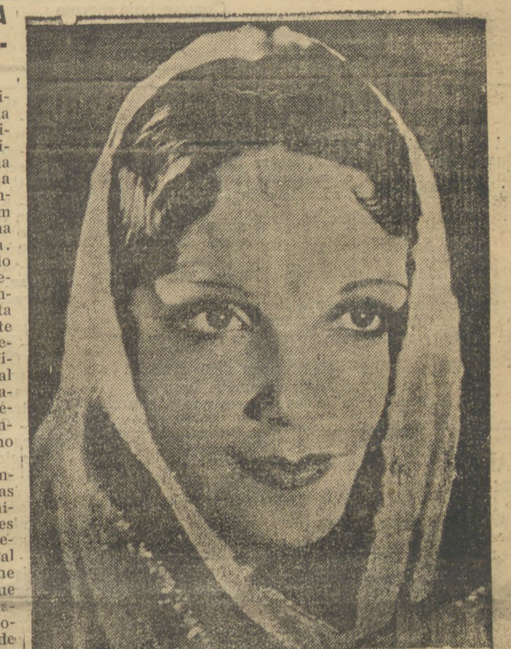
O DESTINO EXTRANHO DAS GERACOES... — Rabindranath Tagore é um altissimo e sereno poeta da India. Sua sobrinha, Devika Rani, que vemos neste "cliche", é "estrela" do cinema. E como ambos brilham!

BERNA, 26 (D.) — Cumprindo instruções enviadas de Berlim, o ministro plenipotenciario da Alemanha nesta capital visitou hoje o presidente do conselho federal helvético Motta afim de lhe exprimir a segurança de que em caso de guerra a Alemanha respeitaria incondicionalmente a inviolabilidade das fronteiras suizas e a integridade territorial da republica federativa.