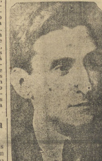
1º ministro Salazar

LISBOA, 26 (D.) — A assinatura do pacto nazicomunista causou estranha impressão nesta capital e em todo o paiz, que não dá nenhuma aprovação a "esse desmoronamento de principios". Os meios catolicos, principalmente, estão fortemente chocados, e dizem textualmente que a Alemanha dá á mão á Espanha vermelha e sem Deus, contra quem combateu ainda ha pouco.