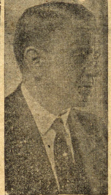
SR. MANOEL RIBAS