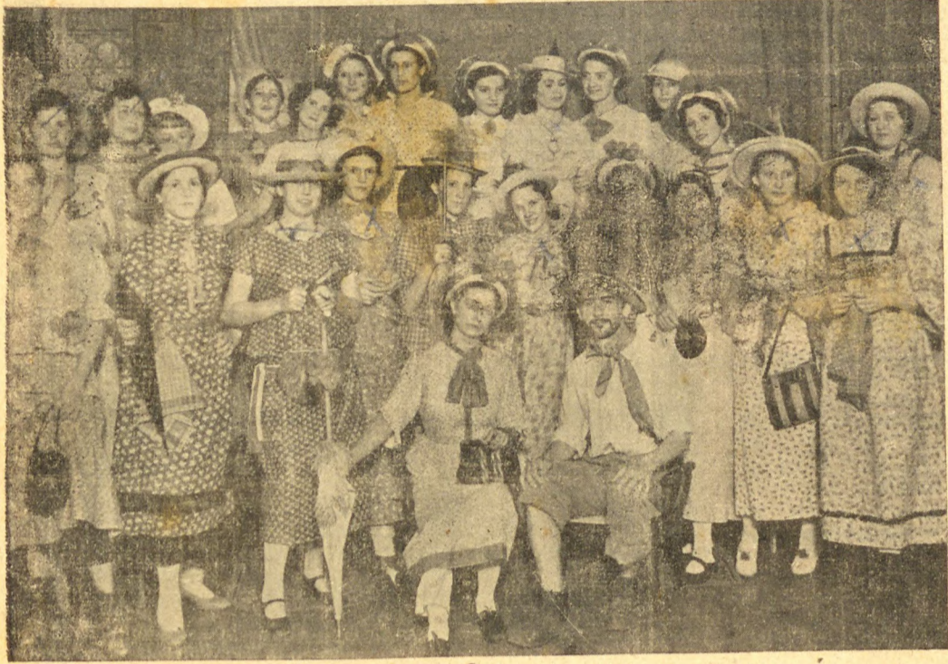
A História como mestra e os exemplos como lição... A fotografia acima é de um dos inesquecíveis blocos do Carnaval de 1938. Anima pessoal! Lenha na fôrnalha! Quem fica em casa quietinho ou é doente ou maluco!

O pleito está renhido. Entrevistado um candidato. Quem não brinca é porque não sabe gozar a vida!