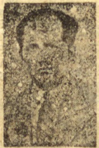
Sr. Lima Cavalcanti

RIO, 11 (D.) — O Tribunal de Segurança Nacional, reunido em sessão secreta, absolvoeu o sr. Lima Cavalcanti, governador de Pernambuco, no processo suscitado contra o mesmo em virtude das accusações de que apontavam envolvido no movimento comunista em 1936.