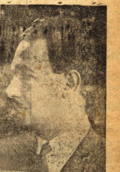
Cap. Felinto Muller

RIO, 11 (D.) — Ao contrario do que era esperado, annuncia-se que o sr. Getulio Vargas concederá o pedido de demissão apresentado, em caracter irrevogavel, do cap. Felinto Muller.