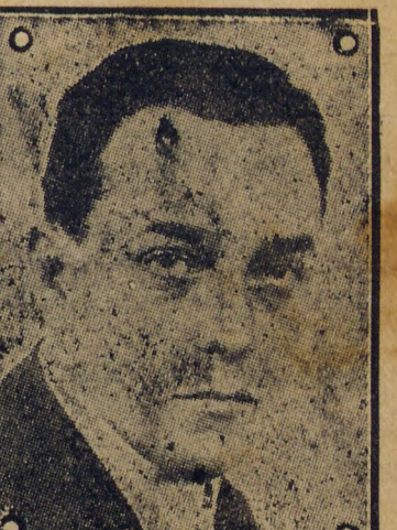
Ministro MACEDO SOARES, que ficará á frente da pasta das Relações Exteriores e da Fazenda

RIO, 9 (D) — Em reunião do Ministerio levada a effeito hontem no palacio Guanabara, ficou assentada a partida, amanhã, do sr. Arthur Costa, ministro da Fazenda, para Nova York e Londres. O titular da pasta da Fazenda embarcará, com effeito, amanhã, para Nova York, seguindo depois dali