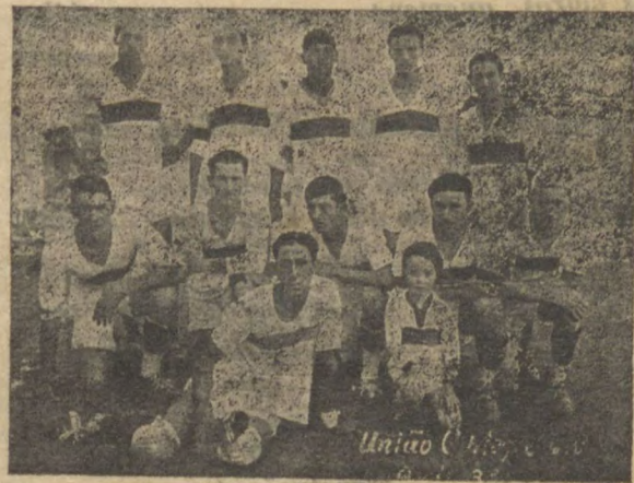
O "11" tricolor

O presidente de União desmente QUE VARIOS AMADORES DAQUELLE GREMIO PRE-TENDAM MUDAR DE CAMISA