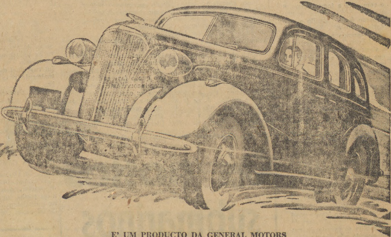
E' UM PRODUCTO DA GENERAL MOTORS

NOVA CARROSSERIA INTEIRAMENTE DE AÇO. — Silenciosa como uma estrella no céu, a carrosseria Uni-Steel, inteiramente de aço, do novo Chevrolet, offerece mais conforto e segurança e é mais espaçosa, porque o motor foi posto mais á frente. Nella, ha assentos mais amplos, portas e janellas mais largas, e não ha tunel, quebrando a harmonia do soaího. E ha mais: freios hydraulicos aperfeiçoados, Acção de Joelho, Engrenagens Hypoid, e outras vantagens que tornam o Chevrolet, mais uma vez, o dominador das estradas e ruas.