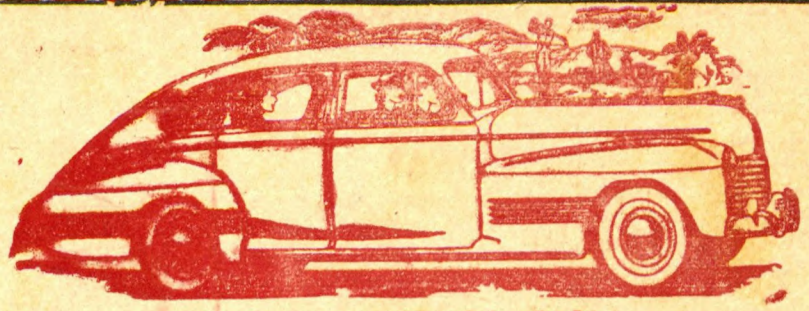
Aqui mostramos um Sport Sedan De 1936 Em 1940 o "PONTIAC" foi o primeiro em linhas, elegancia e distincção. Este ano continua sendo o vanguardeiro no Estile, no Conforto, na Potencia e na Economia.

Analisando-se o Estado Nacional encontramos suas linhas estruturais orientadas no sentido de justaposição ás lindes da Nação brasileira.