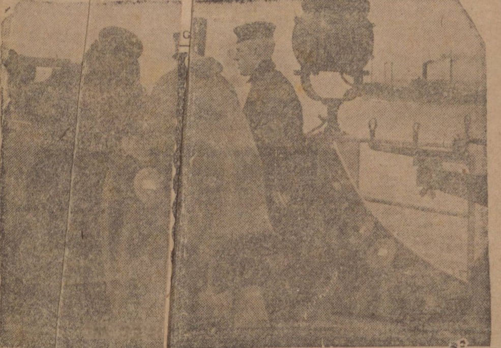
A UNIDADE DA ESCOLTA DE INSTRUÇÕES AOS NAVIOS DO COMBOIO — A bordo de um dos "destroyers" em serviço de proteção a um comboio, o singei- ro, juntamente com os seus do- mínios de Metouia e Oudref, as unidades que fazem parte do COMANDO DO GENERAL VON AR- MIN, britânico mas foram de- sativadas. Os soldados norte america- nos, por sua vez, conseguiram (Conclua na última página)

Aquele Departamento de Estado confirmou, um inter- prete do "Federal Reserve Bank" de New York pelo qual se expõe que os bancos centrais e governos adquiriram de 17 anos.