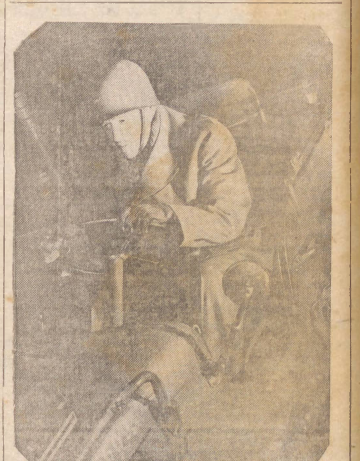
JACK HOLT — O capitão do exército norte-americano que se vê nesta fotografia no volante de um "jeep" é o conhecido astro Jack Holt, que se retirou do cinema para ingressar como voluntário nas forças armadas estaduni- denses.

No dia seguinte, os mes- mos guerrilheiros minaram outra linha férrea alemã e as explo- sões fizeram desmoronar um trem. Foram destruídos 21 va- gões em que viajavam oficiais e soldados inimigos".