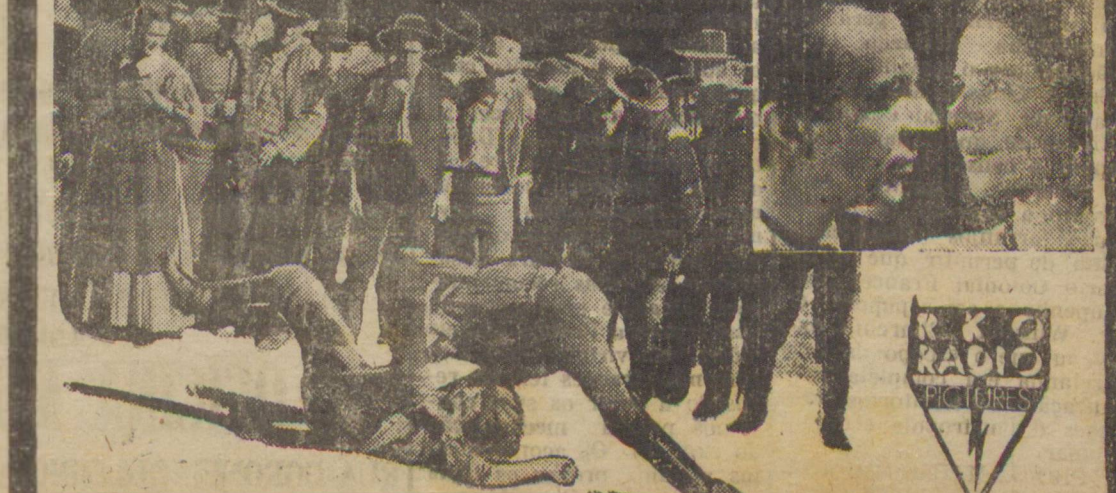
"Abe Lincoln In Illinois"