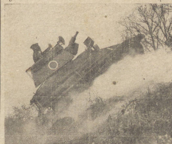
Depois do desastre militar da França a Inglaterra deu inicio á mecanização intensiva de suas divisões, idealizando um carro de assalto que reúne extraordinaria velocidade e grande poder ofensivo, cujo tipo vemos no clichê acima.

RIO, 26 (Da Sucursal) — A Associated Press comunica de Buenos Aires que delegados alemães já entraram em contacto com os governos da Argentina e do Uruguai para o estabelecimento de um gigantesco plano comercial, na base de troca.