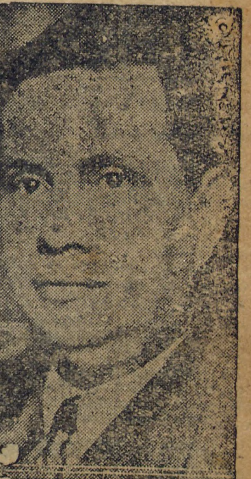
General GÓES MONTEIRO

RIO, 7 (D) — Ouvido pela reportagem de um dos jornaes da tarde, o general Góes Monteiro, ministro da Guerra, declarou que estava marcada para o 3.º dia de carnaval um movimento militar em todo o paiz, encabeçado por officiaes extremistas. Adiantou o titular da pasta da Guerra que os officios verificados em Fortaleza e Manaus não passaram de