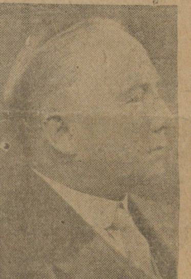
SIR JAMES GRAIG, secretário da Guerra britânico

truidas trincheiras, fossos e mil e uma armadilhas contra os invasores, o que é bem um sintoma da hora grave que o Reich está vivendo.