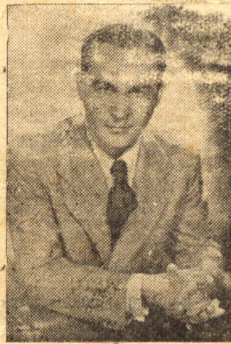
Amor! Alegria! Musica.

Eis os tres elementos deste filme encantador.