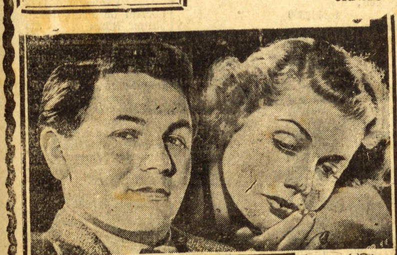
JOHN GARFIELD · SHERIDAN PAT O'BRIEN BURGESS MEREDITH

Hoje - 4ª feira, ás 8.30 — Hoje O melhor e mais lindo programa noturno da cidade