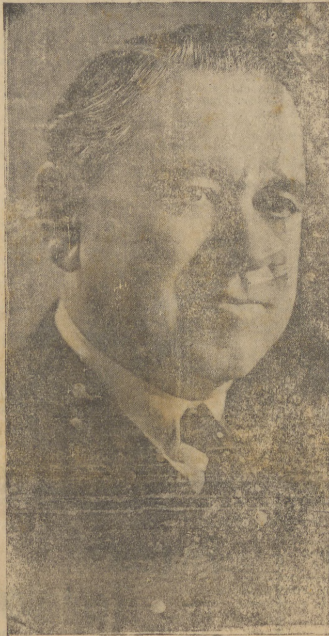
O sr. Manoel Ribas, o grande administrador que, dotado de ferrea força de vontade e de larga intelligencia constructiva, está reerguendo todas as fontes de riqueza do Paraná

A' noite, 20 horas, realizarse-á o lauto banquete, no Club Germania, que Ponta Grossa oferece ao seu dilecto filho, para significar o justo orgulho que sente em vê-lo á frente do mais alto posto governamental do Estado e por vê-lo, no desempenho dessas honrosas funções, engrandecendo, atra-