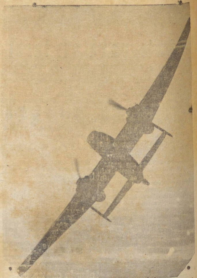
O NOVO BI-MOTOR DE BOMBARDEIO "AVRO MANCHESTER", NOTAVEL TANTO PELA SUA VELOCIDADE COMO PELO SEU LARGO RAIO DE AÇÃO E PODER DEFENSIVO

Owens Valley, o mais moderno "boom town" da California, é o melhor exemplo do que foi possível fazer durante a primeira fase da evacuação da população japonesa da Costa do Pacifico. O local escolhido, com uma área de 6.000 acres, será o lar temporario de cerca de 10.000 japoneses. Todos ali serão empregados, na agricultura, em fabricas de conserva e outros fabricando móveis para as suas próprias vivendas. Está também planejado um vasto programa de recreios, incluindo campos para "base ball" e outros desportos, assim como programas cinematográficos. Serão ali estabelecidos 100