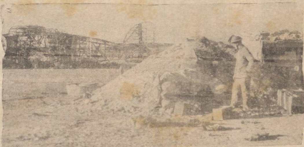
HOMS E TOMADA PELOS BRITANICOS — Em Homs, importante base do "eixo" na Líbia a ofensiva do 8º Exército Imperial Britânico encontrou o seu fim. Os italianos foram completamente inutilizados. Em sua retirada, os italo-germanos deixaram enormes quantidades de provisões e combustíveis e queimaram todas as fabricas e oficinas.

rir às derrotas nazistas na Rússia. Na impossibilidade de continuar ocultando ao povo alemão a derrocada das armas germânicas, o alto comando nazista informa que de 250 mil soldados que atacaram Stalingrado, só restam atualmente 50 mil. Esses contingentes, — continua o comando alemão — estão comprimidos pelo cerco russo, sem a menor esperança de salvação. Diante da surpreendente confissão do dr. Goebbels, opina-se que o governo alemão está preparando o espírito do povo para receber no futuro, do Cáucaso, de Leningrado e da frente central, que a censura alemã ainda conserva de "quarentena".