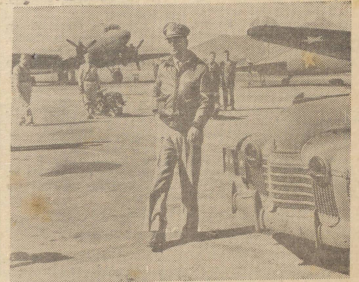
GENERAL DOUGLAS MACARTHUR -- O general Douglas MacArthur, comandante das forças das Nações Unidas no sul do Pacífico, chega a uma base aérea avançada norte-americana para assumir pessoalmente o comando das tropas que operam na Nova Guiné.

Circunstância interessante é a de que a nova lei do imposto sobre a renda veio favorecer aos pequenos contribuintes deste tributo, pois não lhes agravando a contribuição com qualquer majoração, a taxa concedeu-lhes maior quota para abatimentos relativos aos encargos de família. E' deveras confortador constatar-se, por exemplo, que devido à nova situação da guerra, nossas taxas progressivas do imposto sobre a renda são muitas vezes inferiores às taxas do mesmo imposto na Inglaterra e nos Estados Unidos, onde, de majoração em majoração, chegaram a 95 e 80 por cento, respectivamente.