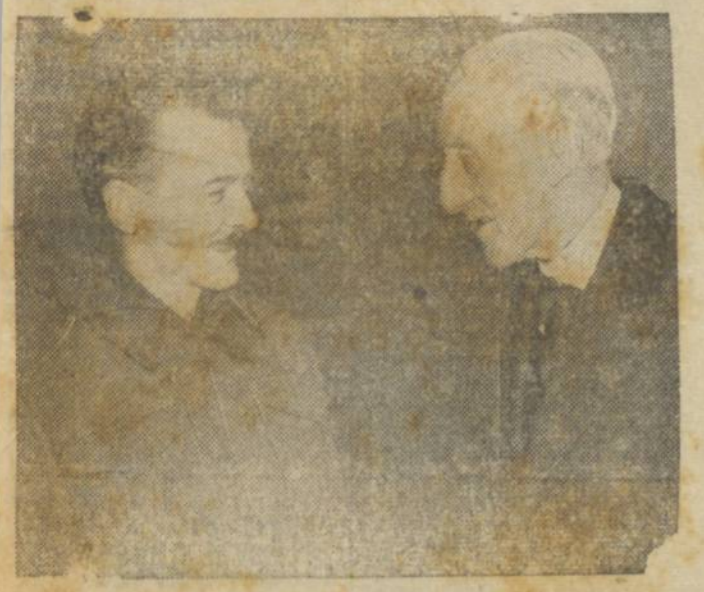
Voluntario yanke na Inglaterra a palestra com sir Mackenzie

LONDRES, 8 (Reuter) -- Chegou a esta capital a missão militar russa, da qual faz parte o general Goukoff e o contra-almirante Kosnoff.