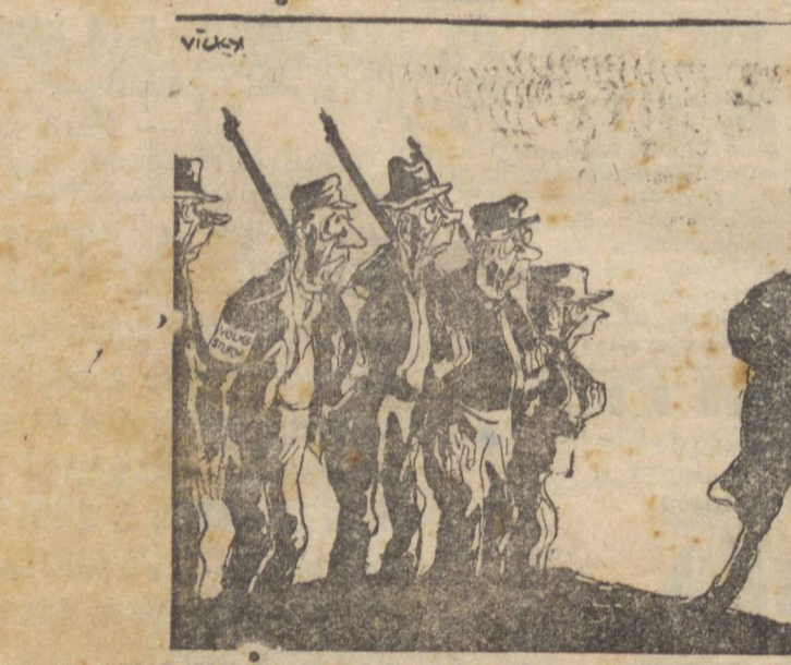
VALENTES SOLDADOS DA "WEHRM ACHT" — SENTIDO!

to. E isto, assegurou aquele estadista, porque o Paraguai não deseja relações com "qual quer país que mantenha vinculações oficiais com o Japão e a Alemanha".