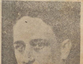
SR. MARCONDES FILHO

RIO, 28 (P.P.). — O sr. Marcondes Filho deixou a pasta do Trabalho em face de incompatibilidade com o ministro da Guerra — informa o "Diário Carioca".