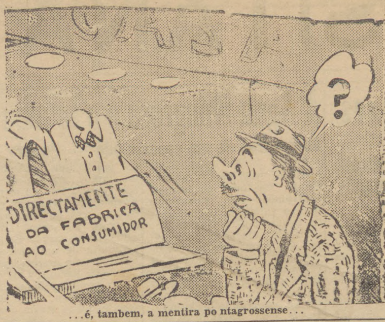
...é, tambem, a mentira po niagrossense...