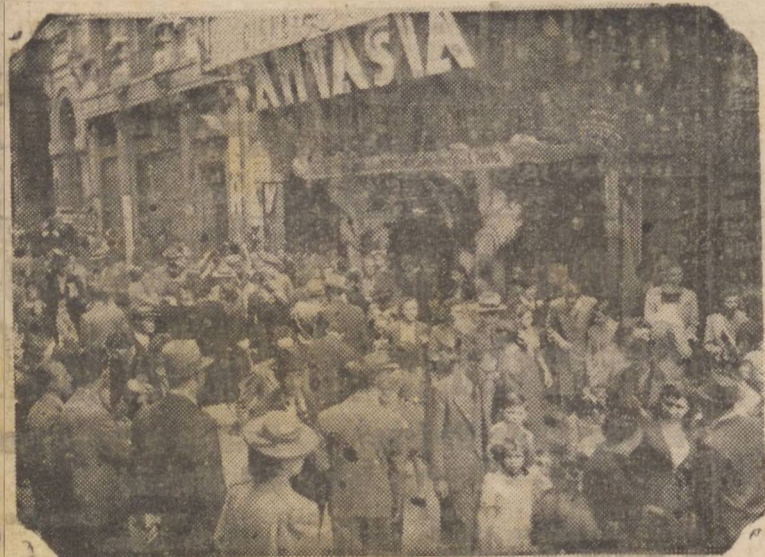
PORQUE SERA TANTA GENTE ENTRANDO NESTE CINEMA? A resposta teréis, hoje, indo ao IMPERIO!

O cliché abaixo, bem nos mostra o exito colossal de "FANTASIA"!