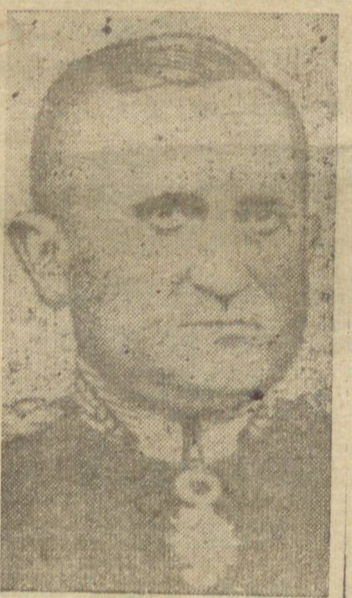
General Eurico Gaspar Dutra, Ministro da Guerra

os oficiais que ali servem, assim como o contingente de praças, formados no jardim