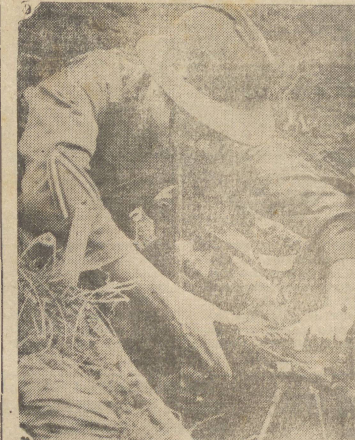
O PREPARO TECNICO DOS NOSSOS VALOROSOS SOLDADOS OFERECE FLAGRANTES INTERESSANTES, COMO OS QUE VEMOS ACIMA: UM CABO EXAMINANDO UMA METR ALHADORA E UM SOLDADO DO SERVICO DE TRANSMISSOES ESTENDENDO OS FIOS PELAS ARVORES