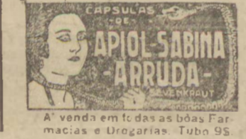
A venda em todas as boas Farmácias e Urogarias. Tubo 95

As CAPSULAS SEVENKRAUT (Apiol-Sabina-Arruda) têm o seu grande êxito assegurado pelo rigor científico que preside ao seu preparo bem como à pureza de elementos empregados na sua composição química.