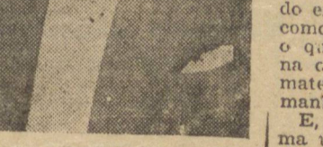
RIO, 11 (A. N.) — O Conselho Nacional de Educação votou e o ministro da Educação vai homologar, um parecer no sentido de que todas as cadeiras do ensino secundario sejam exercidas mediante concurso, mesmo as de trabalhos manuaes, extandendo-se assim ás denaais disciplinas, como o que resolveu em relação ao inglês e francês

RIO, 11 (A. N.) — O ministro da Fazenda, em aviso de hoje dirigido ao presidente do Banco do Brasil, autorizou a se estabelecimento de credito a conceder, através de sua Carteira de Credito Agricola e Industrial, mais 6 meses de prazo aos devedores por financiamentos de algodão, ca safra de 1943, para a opção de que