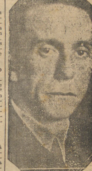
Goebbels, Ministro da Propaganda do Reich, que prometeu ao povo de Dantzig, num discurso ameaçador, a imediata anexação da Cidade Livre

EM LONDRES O EMBAIXADOR BRITANICO EM BERLIM