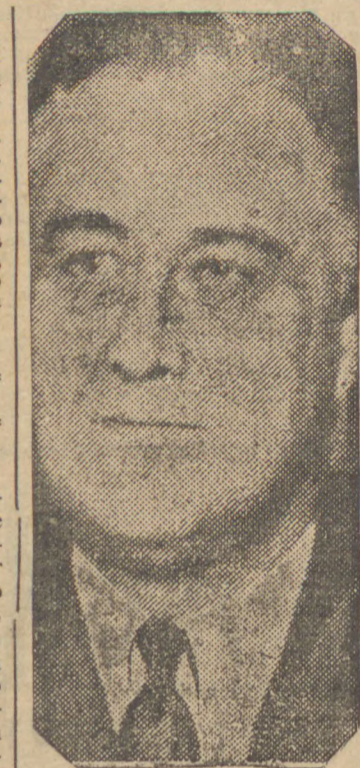
Franklin Roosevelt, chefe do Governo Americano, ao qual o Senado vem fazendo oposição

O presidente americano, referindo-se a Lei de Neutralidade, declarou que o Senado precisava voltar atrás de sua decisão na questão do embargo a venda de material belico a paizes beligerantes, de vez que, não levantado o embargo, só os Estados Totalitarios seriam favorecidos.