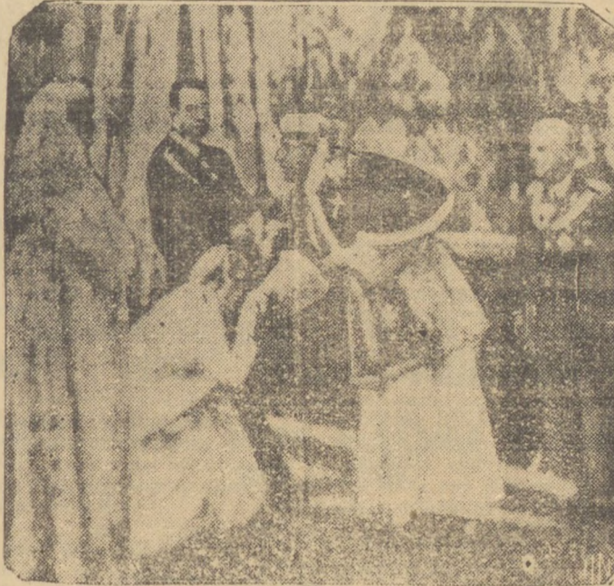
UM FLAGRANTE HISTORICO E RARO. — O Papa Pio XII quebra um precedente que tinha durado 70 anos, indo visitar os reis da Italia, em Roma, afim de pedir sua cooperação em favor do estabelecimento da paz europeia. A princesa Maria José está ajoelhada para beijar o anel pontificio. A princesa Helena e o príncipe Humberto estão ao lado, vindo-se o rei Vittorio Emanuel, Imperador da Ethiopia e Albania, á direita.

RIO, 4 (Da Sucursal) — Um telegrama de ultima hora, procedente de Berna e distribuido pela U. P., anuncia que os meios oficiais italianos nas ultimas 24 horas têm estado agitadissimos, em face do rumo perigoso e apressado que os recentes acontecimentos vêm dando á situação da Italia frente ao conflito europeu.