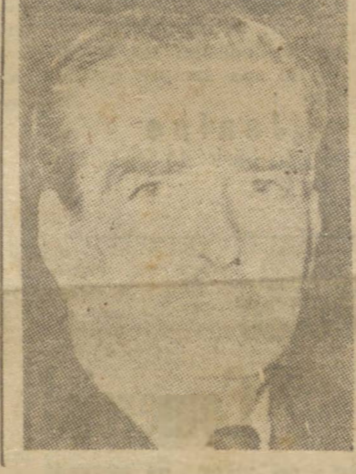
SR. EDEN (Gran-Bretanha)

MOSCOW, 20 (U.P.) — Informa-se que as tropas russas penetraram entre as vacilantes defesas alemãs e ameaçam cercar milhares de soldados nazistas, no Dniepper. Já realizado, enviando-se regularmente pacotes de pequenos portes. Nesse interim, o esquadrão brasileiro manifestou sua gratidão á "Fraternidade do Fôle" e á sua madrinha, embaixatriz do Brasil.