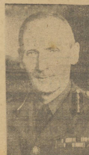
GENERAL MONTGOMERY, COMANDANTE DO 8º EXERCITO

ARGEL, 20 (U.P.) — O 5.º Exército aliado, empenhado com vigoroso impulso, uma nova etapa da sua marcha sobre Roma, para cuja reconquista de outras 5 localidades, adiantaram suas linhas, entre 8 e 11 quilômetros, num avanço geral em toda a frente. Os potentes golpes aliados estão esmagando as forças de Kesserling, expulsando-as para uma nova linha de defesa, desde Manfreda. Oito quilômetros ao norte da desembocadura do Volturno, até Venafro, 20 quilômetros ao oeste de Isernia. As forças alemãs se retiraram em tre nuvens de incêndios e procuraram retardar o alvo de seus perseguidores, mediante o fogo de sua artilharia e metralhadoras, assim como o emprego de milhares de minas. Não obstante esses obstáculos, as forças do general Clark se apoderaram de Dragani, num avanço de 3 quilômetros para as montanhas do Volturno e Rocca Romana, num avanço de 8 quilômetros ao norte de Libero (comando) Vignero, 9 quilômetros ao norte de Capua e Pignatelli, que domina a estrada principal para Roma e se encontra a 8 quilômetros ao norte de Capua. Noutro lado, as forças do 8.º Exército, que faz parte da 73.ª Divisão, a primeira a enfrentar os alemães na Tunísia, efetuou avanços de 8 quilômetros, 11 ao norte de Campobasso. Vinciguerra, ocupando Petacina, 14 quilômetros ao noroeste de Termoli. Os alemães, que, segundo um porta-voz, matam sem