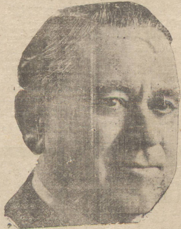
Sr. Manuel Ribas, eminente Interventor Federal

Consoante vimos anunciando, terá lugar hoje, á hora 10, a solenidade da inauguração do magnifico predio levantado na praça 5 de Outubro e destinado ás sedes da Delegacia Regional de Policia e do Corpo de Bombeiros.