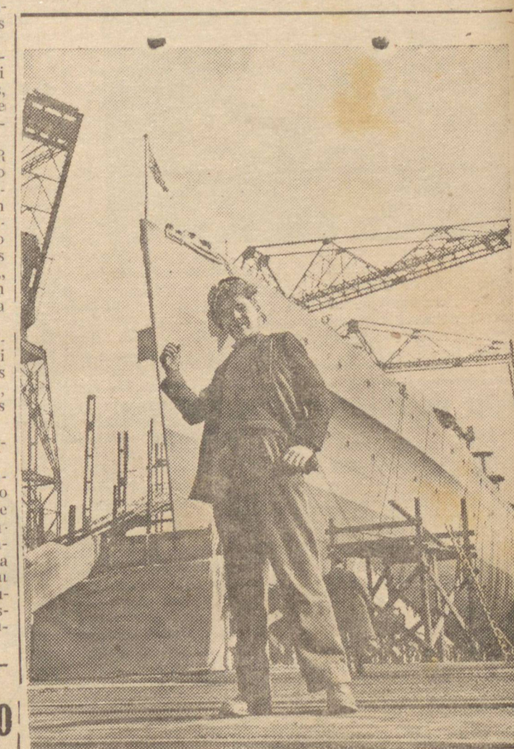
A GRA-BRETANHA TEM ATUALMENTE MAIS NAVIOS DO QUE ANTES DA GUERRA — Orgulhosamente um modelo de um estaleiro britânico indica outro cruzador britânico pronto para navegar. Desde que a guerra começou os estaleiros ingleses trabalham 24 horas a fio, apurando o navio após navio, de maneira que a Marinha Britânica está mais poderosa do que no início da guerra.

Estas operações se desenvolveram na região média do rio Don, relativamente a zona setentrional do Caucaso, informou o comunicado que as forças russas passaram á ofensiva e avançaram de 18 a 20 quilômetros ao sul-este de Nalchik, reconquistando seis importantes centros povoados.