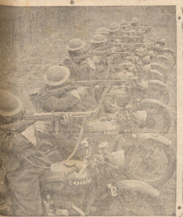
INFANTARIA BRITANICA DE HOJE — A mecanização do exército britânico é agora tão grande que na infantaria os carros os soldados que seguem a pé. Nesta fotografia vê-se uma admirável unidade de infantaria, constituída das unidades motocicletas e ótimas metralhadoras.