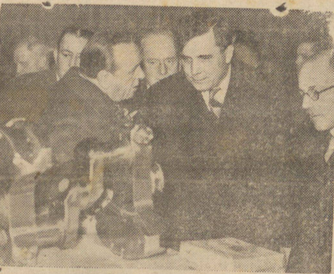
O SR. WENDELL WILKIE EM PALESTRA COM OS JORNALISTAS

(NEW YORK — Novembro marcado, — via aérea) — Depois de Roosevelt, no presente momento, Wendell L. Wilkie é o homem público que reúne maiores possibilidades de presépio popular nos Estados Unidos.