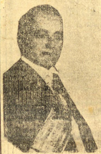
Presidente Getúlio Vargas