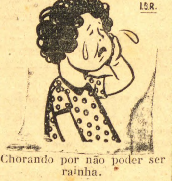
Chorando por não poder ser rainha.

Muito bem! Muito bem! Não dá chifrada em toureador