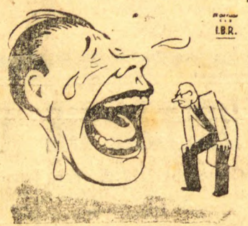
Dizem que o Franco também é candidato. "Tô só espiando..."

Seria bom, seria bom. Você levar uma lição para dar valor ao amor! Inda hei de ver, seu "Barba azul", O pão comer e suas barbas arder! OS CONCURSOS