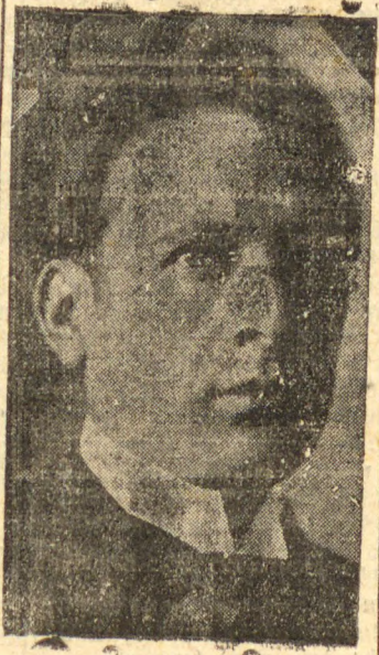
General Flores da Cunha

MONTEVIDEU, 3 (U. P., agencia norte-americana). — Em declarações relacionadas com as entrevistas que manteve com o chanceler Osvaldo Aranha, o general Flores da Cunha disse: «Mantenho com Osvaldo Aranha fraternal amizade desde ha muitos anos, cimentada na paz e na guerra, pois sob minhas ordens Osvaldo Aranha foi um bravo comandante revolucionario. Não me causou portanto nenhuma estranheza o seu gesto cavalheiresco, visitando-me em meu desterro para estreitarmos mais uma vez nossas mãos por cima de quaisquer discrepancias de ordem politica.