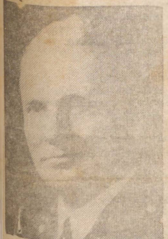
Acaba de falecer o General Andrew G. B. Slesinger, comandante em chefe das Forças Norte Americanas na frente de operações da Europa.

LONDRES, 4 (U.P.) — Urugente — Vítima de um desastre, de aviação na Islândia,