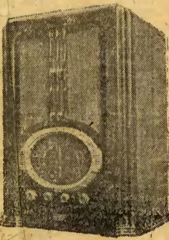
Mod. 1 valvulas