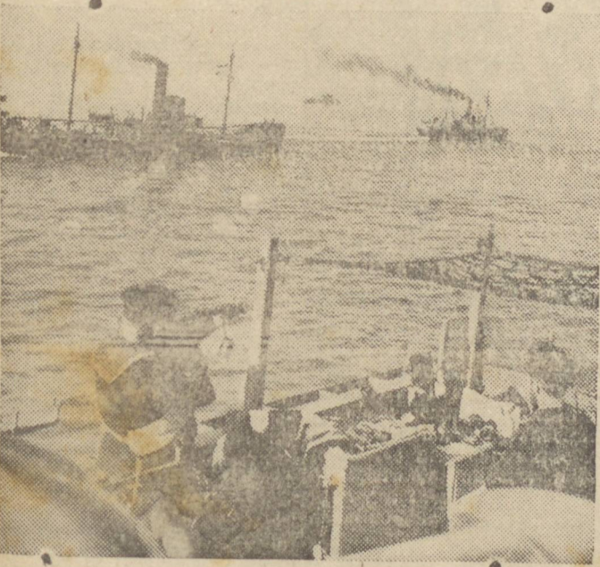
ESCOLTANDO UM COMBOIO BRITANICO — Guardados pela sempre vigilante escolta de destroyers, singram os mares os navios de um comboio britânico, inteiramente confiante. Os novos métodos britânicos de detenção e destruição de submarinos têm dado bons resultados na Batalha do Atlantico.