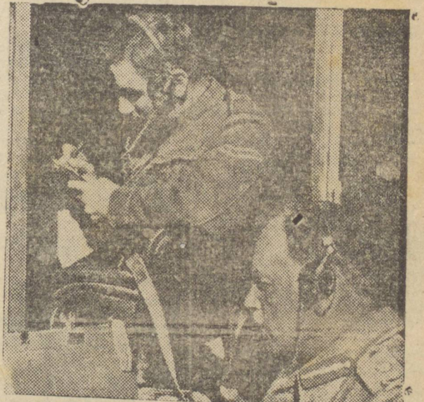
SUM DOS CHEFES MILITARES BRITANICOS EM OPERAÇÃO NA LIBIA. — O tenente general Villoughby Norrie, um dos chefes britânicos que luta contra as forças do "eixo" na Africa do norte, fotografado no momento em que enviava uma mensagem pelo radio aos comandantes das forças da vanguarda que se achavam sob as suas ordens. O general Norrie desempenhou um papel de grande relevo na captura de Bardia e Halfaya, depois que o grosso das forças de Von Rommel tinham sido rechassadas para as fronteiras da Tripolitania.

Acrescentam as informações que os alemães estão nervosos ante a possibilidade de dum offensiva aliada a ce'l., tanto que o Alto Comando alemão ordenou a formação de unidades especiais para combater a ação dos comandos.