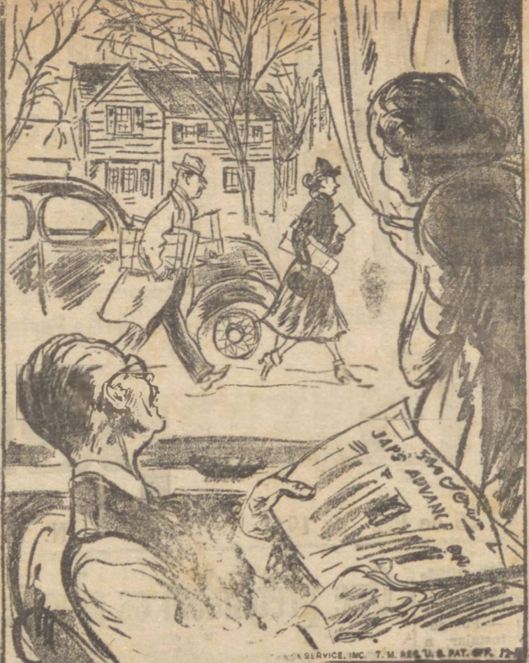
— Eles brigaram outra vez, este ano, na loja de brinquedos.