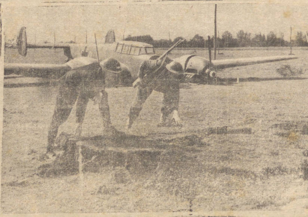
PEQUENOS RUIBROS DA GUERRA — Policiais e fuzes examinam a cratera feita por uma bomba germanica na região sudoeste da Inglaterra. O avião alemão errou a pontaria e no objetivo, pois o aparelho que se vê ao fundo, não passa de um bombardeiro tedesco posto abaixo pelos caças británicos

Comunicamos á nossa querida freguezia que até o fim do corrente mez de Dezembro iniciaremos a venda dos novos e excelentes motores, um de 6 cilindros com 90 cavalos de forca e outro de 8 cilindros com 100 cavalos de forca. Assim, pois, as novas caminhões Ford 1942, os caminhões que mais trabalham no Brasil, e para os quais nunca faltam peças. — Av. Vicente Machado 73 SCHWIDERSKI, PLAVITI & CIA.