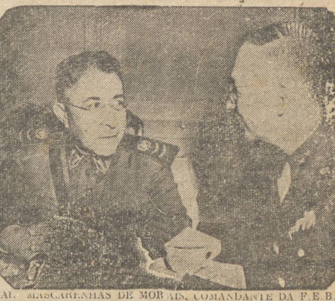
GAL. MASCARENHAS DE MORAIS, COMANDANTE DA F.E.B.

O fato era publico e notório na cidade na localidade, acrescenta o correspondente.