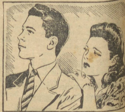
— Ficaste "abafado"? Pois vais ver como se invertem os papéis. Aposto que ela entregará os pontos!