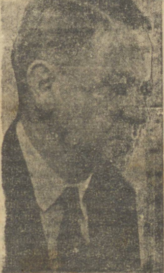
SR. MANOEL RIBAS, futuro presidente do Estado

Berlim, 23 (UP) — A promotoria atada concluiu o processo contra Friederich Bachman, antigo burgomestre de Tiergarten, acusado de desobediências às ordens do governo militar e de atos corruptos. O tribunal encontrou insuficiências de provas nas três acusações de corrupção e numera de desobediência as ordens do governo militar. Há ainda outras acusações que permanecem de pé.