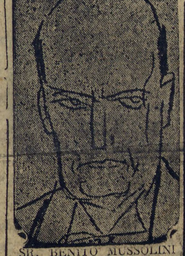
SR. BENITO MUSSOLINI