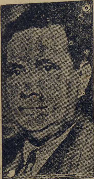
GENERAL GÓES MONTEIRO

"São os catilinas da nação que estão fazendo essa obra de devastação... começa o general Góes Monteiro depois de pequena pausa. — O exercitô está contaminado pelos seus discursos. Eu apenas descerrei um voto. Não foi sem fundamento que o fiz e opportunamente os denunciei à nação."