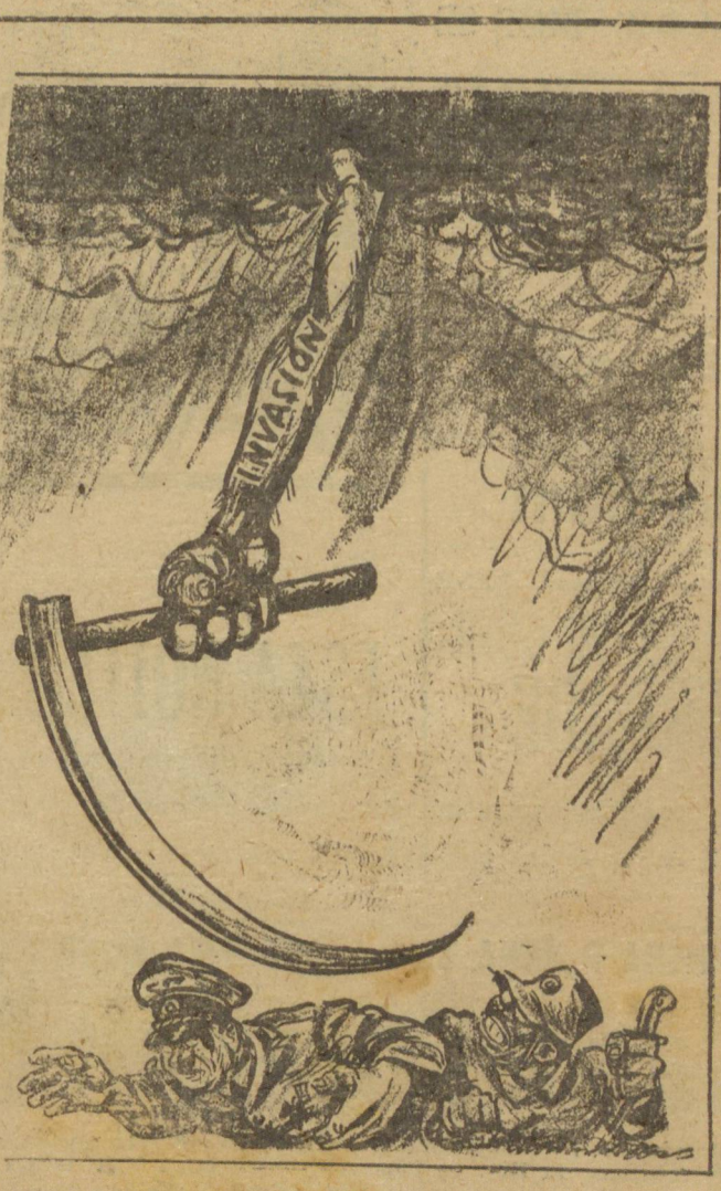
COMBÇOU O SEGU NDO "ROUND"...

WASHINGTON, 5 (U. P.) — Quatro anos depois de Mussolini ter declarado guerra ao mundo, dos balcões do Palácio Venezia, Roma foi libertada pelas tropas das Nações Unidas. Coube ao gal. Clark, do exército norte-americano, a honra e a glória de ter comandado as divisões que primeiro flanquearam os muros da Cidade Eterna. Badalame, em sinal de regozijo, os sinos das igrejas romanas e o povo de Roma enche de flores os soldados das democracias libertadoras. Roma é a primeira capital do "eixo" a cair em posse dos exércitos aliados. Pese-se às fanfarronadas do "fuehrer", já desmentidas na libertação da Cidade Augusta. Após Roma cairão, também, Berlim e Tokio. As operações anfíbias de maior ou menor envergadura serão levadas a cabo para atingir o coração da capital do nazismo e berço do militarismo nipônico. Foi por meio das operações anfíbias que as tropas das Nações Unidas chegaram a Roma, assim como triunfaram na consequência desse objetivo, vencendo todas as resistências, no propósito já deliberado de bater as ferreas totalitárias em seus respectivos covis. O que foi Netuno e Anzio será amanhã qualquer parte da costa europeia, ou qualquer parte da costa japonesa. As democracias não fazem (Conclue na 6.ª pag.)