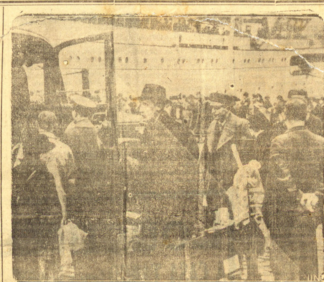
LONDRES, janeiro — Em execução ao plano, segundo o qual todos os alemães residentes nos países bálticos devem regressar ao Reich, vem-se estas pessoas chegando da Estonia, no momento em que desembarcavam no porto de Stettin, Alemanha, dirigindo-se a um onibus que as conduziu a Posen, que está situada no ex-corredor polonês.